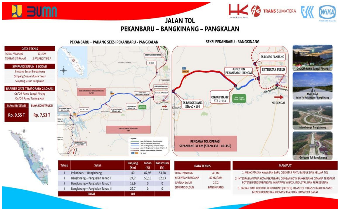
Gambar 1.1 Lokasi Proyek

Proyek Pembangunan Jalan Tol Pekanbaru – Padang Seksi Bangkinang – Pangkalan dilaksanakan oleh Kontraktor pelaksana PT. Wijaya Karya (Persero) Tbk, pemilik pekerjaan HK Infrastruktur dan Konsultan Pengawas PT Eskapindo Matra Konsultan. Panjang ruas tol pekerjaan Proyek Pembangunan Jalan Tol Pekanbaru – Padang Seksi Bangkinang – Pangkalan ini adalah 24,7 km dengan nilai kontrak Rp.3.814.349.660.422 (Termasuk Pajak Pertambahan Niai 10%