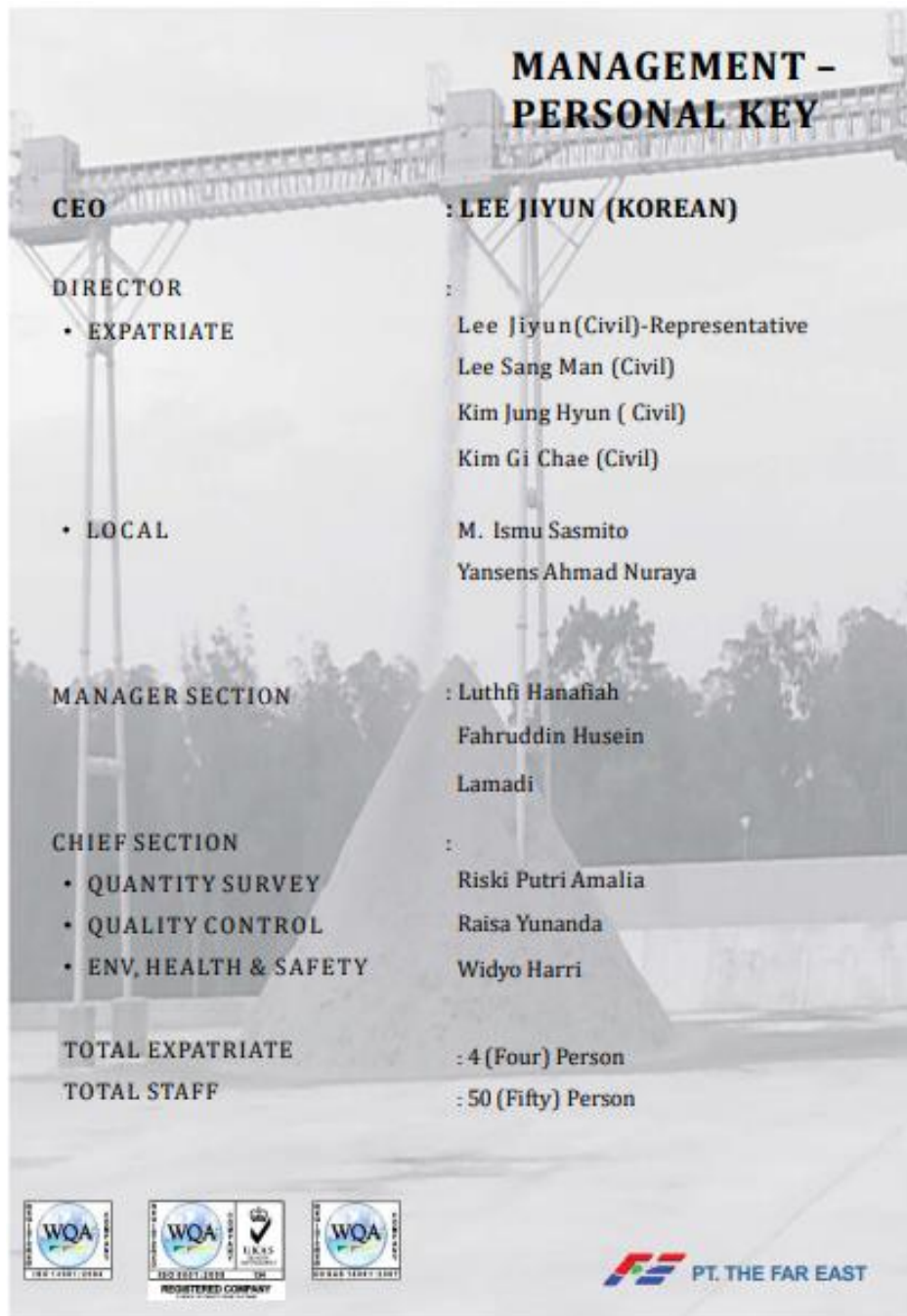
Gambar 1.4 Struktur Organisasi Manajemen Pusat PT THE FAR EAST