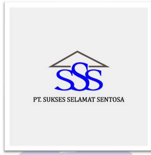
Gambar 1.2. Logo PT Sukses Selamat Sentosa

Logo dari PT. SSS ini tersusun dari tiga huruf S berwarna biru yang bermakna damai dan disusun dibawah satu atap yang sama yang menggambarkan kekeluargaan yang saling menjaga.