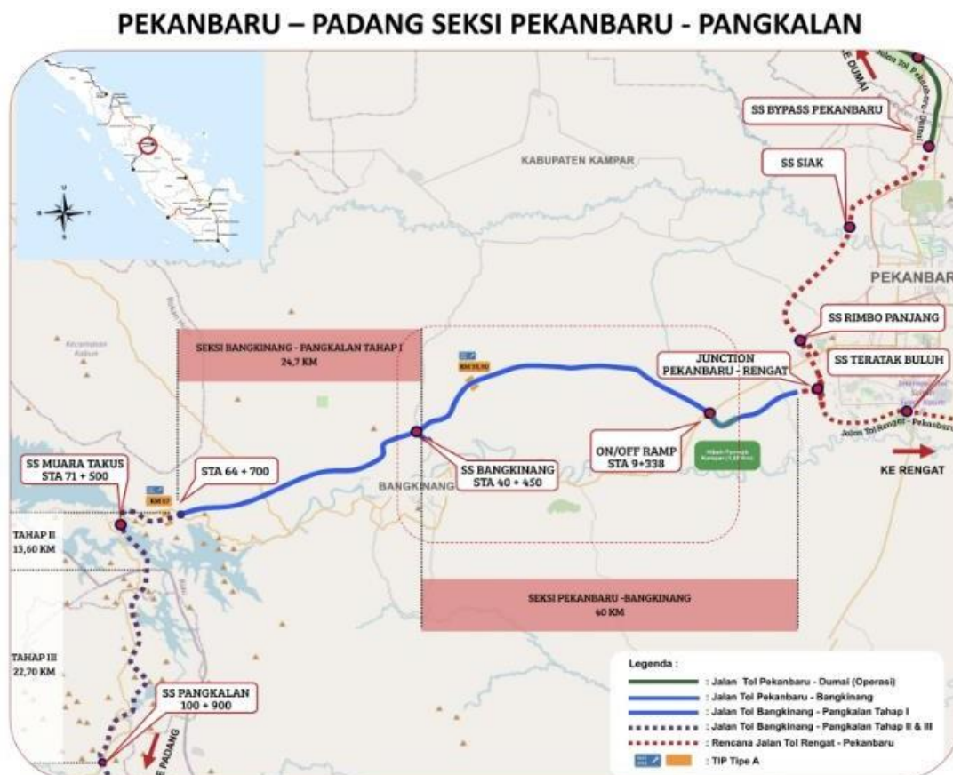
Gambar 1.1 Lokasi Proyek

Proyek Pembangunan Jalan Tol Pekanbaru – Padang Seksi Bangkinang – Pangkalan dilaksanakan oleh Kontraktor pelaksana PT. Wijaya Karya (Persero) Tbk, pemilik pekerjaan HK Infrastruktur dan Konsultan Pengawas PT Eskapindo Matra Konsultan. Panjang ruas tol pekerjaan Proyek Pembangunan Jalan Tol Pekanbaru – Padang Seksi Bangkinang – Pangkalan ini adalah 24,7 km dengan nilai kontrak Rp.3.814.349.660.422 (Termasuk Pajak Pertambahan Niai 10%).