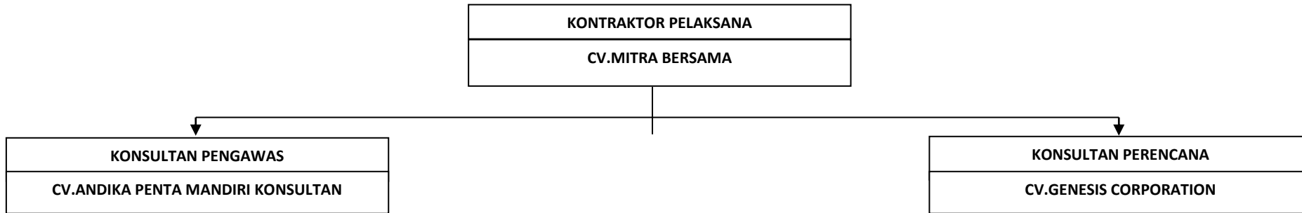
Gambar 1.2 Struktur Organisasi proyek(CV.Mitra Bersama)