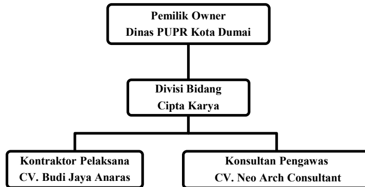
Gambar 1.4 Struktur Organisasi Proyek

Kepala Bidang Cipta Karya mempunyai tugas melakukan koordinasi, fasilitasi dan evaluasi pada Seksi Perencanaan dan Pengendalian, Seksi Pengembangan Sistem Penyediaan Air Minum dan Penyehatan Lingkungan dan Pemukiman dan Seksi Penataan Bangunan.