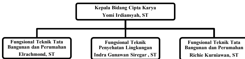
Gambar 1.3 Struktur Organisasi Cipta Karya Dumai

Berikut adalah struktur organisasi divisi Cipta Karya, Sebagai berikut: