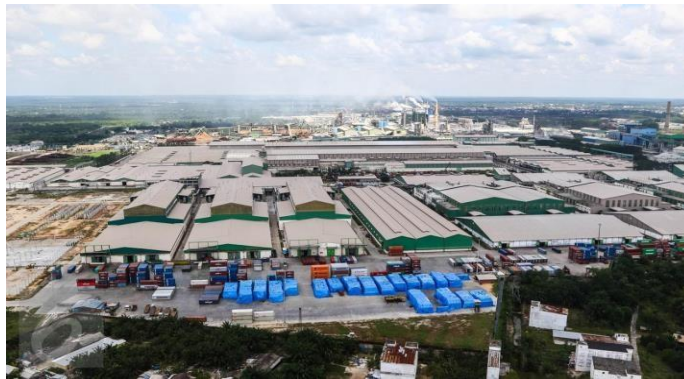
Gambar 1. 1 PT Indah Kiat Pulp & Paper Perawang

Sementara itu pengoperasian mesin kertas line 3 di pabrik kertas Tangerang dilakukan disamping persiapan lokasi pabrik Pulp di desa Pinang Kabupaten Siak Sri Indrapura, Provinsi Riau.