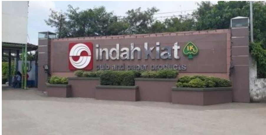
Gambar 1. 2 Logo PT. Indah Kiat Pulp & Pulper

kertas di Tangerang tidak perlu diimport lagi, melainkan dipenuhi oleh pasokan Pulp dari Provinsi Riau. Pabrik ini merupakan pabrik Pulp Sulfat Kelantang berbahan baku kayu pertama di Indonesia. Pada tahun ini juga dimulai pembangunan HutanTanaman Industri (HTI) tahap II.