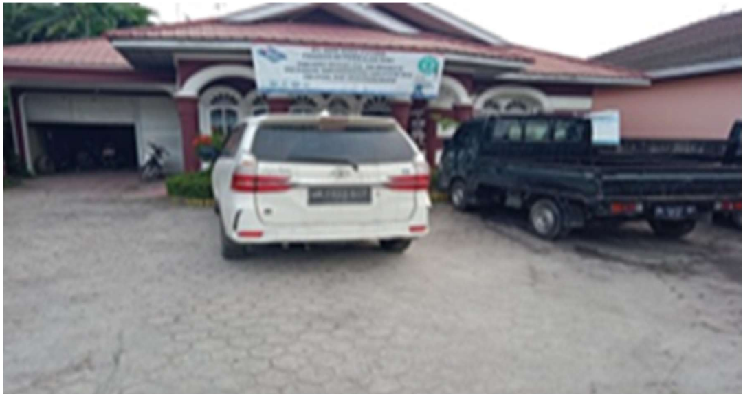
Gambar 1.1 Kantor perwakilan pangkalan susu

Sejarah perkembangan PT Adhi Guna Putera sebagai berikut :