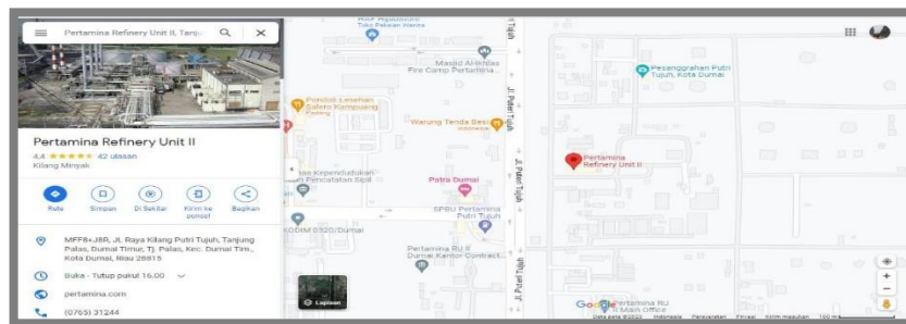
Gambar 1. 2 Lokasi PT kilang Pertamina Internasional RU II Dumai

Kerja Praktik (KP) dilakukan di PT Kilang Pertamina Internasional RU II Dumai yang beralamat di Jl. Putri Tujuh Dumai 28815 Riau-Indonesia, tepat nya di fungsi Finance RU II Dumai. Berikut lokasi KP, yang dapat dilihat pada gambar di bawah ini sebagai berikut: