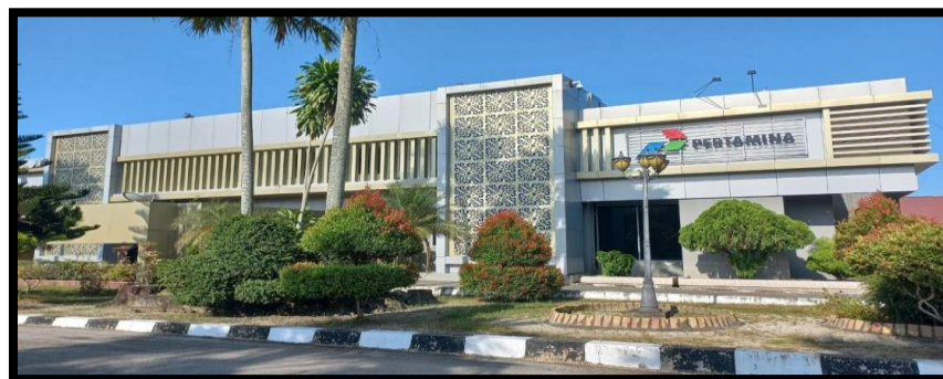
Gambar 1. 3 Profil Fungsi Finance RU II