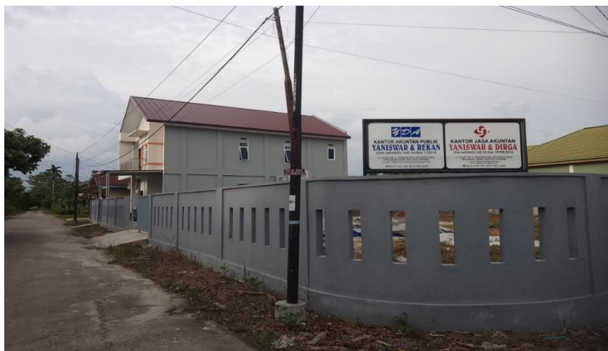
Gambar 1.2 Gedung Kantor Akuntan Publik Yaniswar & Rekan