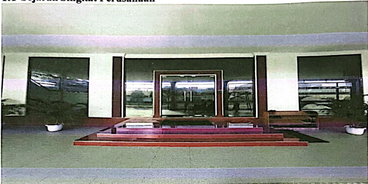
Gambar 1.1 Perusahaan PT. Wasaka Indonesia Jaya