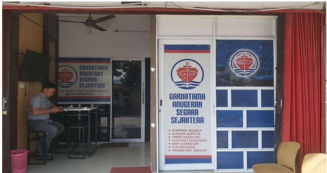
Gambar 1.1 Profil Perusahaan

PT Gardatama Anugerah Segara Sejahtera memiliki kombinasi dari pengetahuan tentang Industri Perkapalan dan dengan staf yang berpengalaman, dan selalu menyediakan kebutuhan dengan kepuasan. PT Gardatama Anugerah Segara Sejahtera mampu memberikan semua kebutuhan kapal dengan harga yang kompetitif terbaik serta bersedia untuk menjadi mitra dengan melayani 24 Jam dan 7 hari selama seminggu.