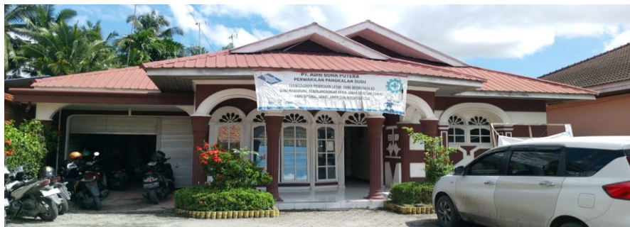
Gambar 1.1 Kantor Perwakilan Pangkalan Susu