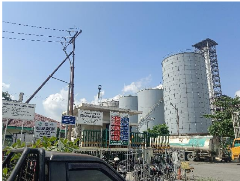
Gambar 1.1 PT Kreasijaya Adhikarya Dumai

PT Kreasijaya Adhikarya Dumai berlokasi di Jalan Datuk Laksamana, Komplek Pelindo1, Buluh Kasap, Dumai Timur, Riau. Pelaksanaan kegiatan kerja praktik dilaksanakan di Departemen Logistik PT Kreasijaya Adhikarya Dumai.