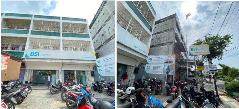
Gambar 1.2 Bank Syariah Indonesia Tbk KCP Duri Hangtuh I