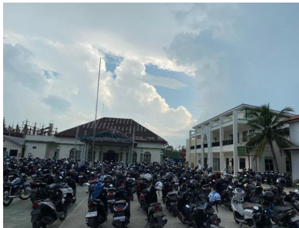
Gambar 1. 3 Parkiran STAIN Bengkulu Sumber: Dokumentasi, 2024

Oleh karna itu, maka diperlukan analisis untuk dapat mengetahui kebutuhan tempat parkir kendaraan pada STAIN Bengkulu sehingga dapat dijadikan acuan oleh pihak STAIN Bengkulu untuk menyediakan lahan parkir. Berdasarkan hal tersebut maka penulis mengangkat penelitian yang berjudul “ Analisis kebutuhan ruang parkir pada kampus STAIN Bengkulu ”.