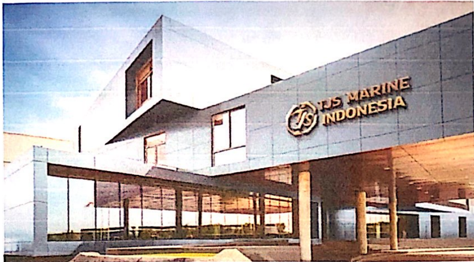
Gambar 1.1.1 Foto perusahaan PT.Tjs Marine Indonesia

Perusahaan PT Tjs Marine Indonesia memiliki Tim Manajerial yang berkualifikasi adalah mantan Perwira / Insinyur senior pedagang dengan pengalaman luas yang disertifikasi dengan pelatihan Kode ISM, STCW 95, ISO 9001:2015, MLC 2006 ( dalam proses ), serta Undang-Undang Negara Kelautan/Bendera terkait, termasuk yang terbaru persyaratan seperti ISPS, ISO 14001.