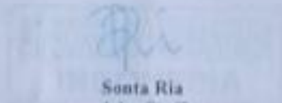
Santa Ria Adm Staff

Dosen Pembimbing Prodi Akuntansi Keuangan Publik