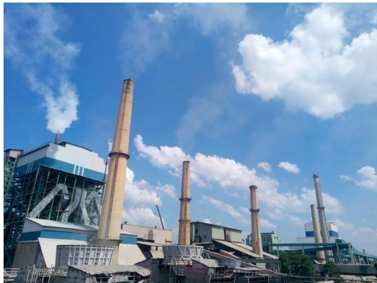
Gambar 1.2 PT. Indah Kiat Pulp & Paper Perawang

Sementara itu pengoperasian mesin kertas line 3 di pabrik kertas Tangerang dilakukan disamping persiapan lokasi pabrik Pulp di desa Pinang Kabupaten Siak Sri Indrapura, Provinsi Riau.