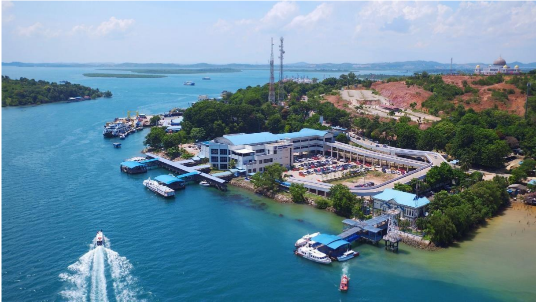
Gambar : Pelabuhan Domestik Telaga Punggur