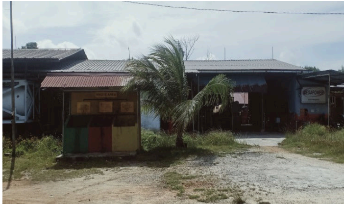
Gambar 1. 1 PT.Megapower Makmur Tbk.