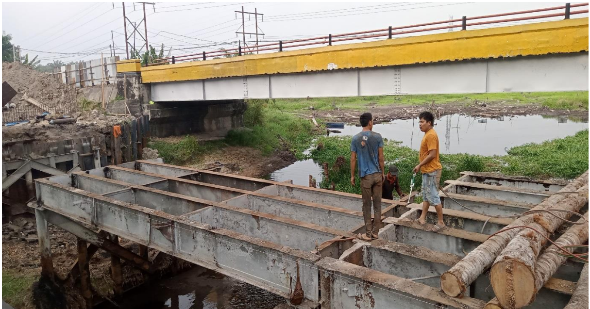
Gambar 1. 1 Jembatan saat dilakukan pengeerjaan