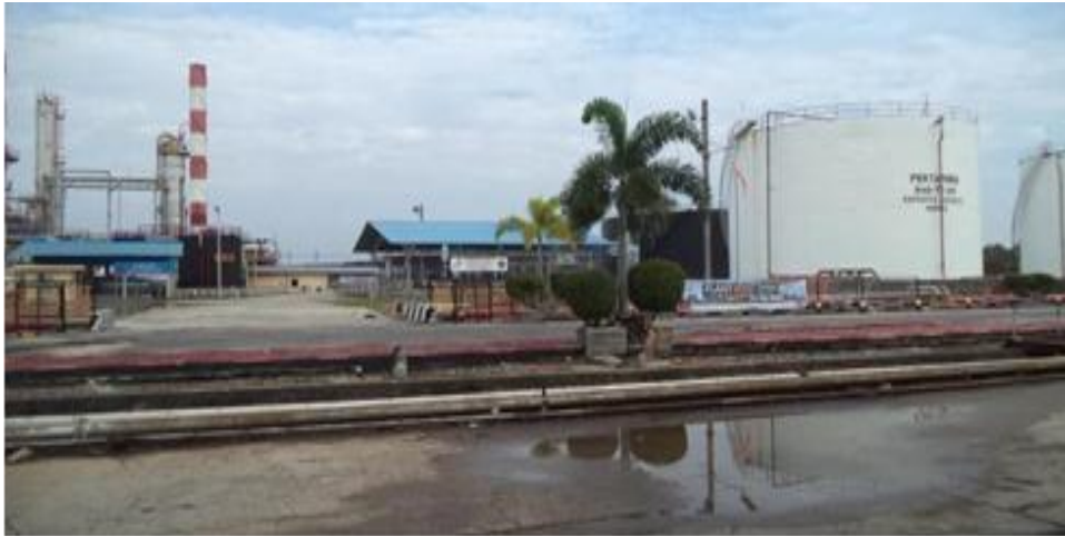
Gambar 1. 1 Kilang Minyak PT. Kilang Pertamina Internasional RU II Production Sungai Pakning (Dokumentasi, 2023)

Pertamina RU II Dumai terdiri dari dua kilang, yaitu Kilang Putri Tujuh di Dumai dan Kilang Sei Pakning. Kilang Putri ketujuh Pertamina RU II Dumai sendiri dibangun pada April 1969 berdasarkan kontrak proyek turnkey antara Pertamina dan Far East Sumitomo Jepang. Pembangunan kilang RU II Dumai dikukuhkan dengan Surat Keputusan Dirjen PERTAMINA No. 33345/Kpts/DM/1967. Konstruksi dikerjakan oleh kontraktor asing, Ishikawajima Harima Heavy Industries (IHDI). Kontraktor melakukan pekerjaan finishing kilang dan utilitas Crude Oil Distillation Unit (CDU), TAESEI melakukan pekerjaan sipil yaitu. H. fasilitas penunjang operasional lainnya seperti tangki produksi, dermaga, pelabuhan khusus dan jaringan pipa. Refinery Unit II merupakan kilang Pertamina terbesar di pulau Sumatera dan memasok 23% kebutuhan minyak nasional (Sukardi, 2013). Saat ini wilayah kerja Unit Pengolahan II Dumai meliputi: