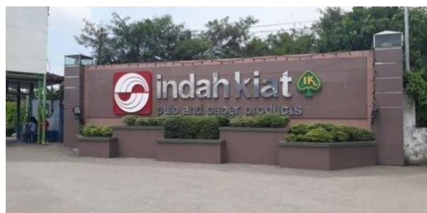
Gambar 1.2 Logo PT. Indah Kiat Pulp & Pulper

Produksi percobaan pabrik pulp dilakukan ditandai dengan peresmian pabrik oleh Presiden Republik Indonesia Bapak Soeharto, pada tanggal 24 Mei 1984. Saat itu kapasitas pabrik pulp sulfat yang dikelantang ( Bleached Kraft Pulp ) adalah 75000 per tahun, sehingga kebutuhan pulp untuk pabrik kertas di Tangerang tidak perlu diimpor lagi, melainkan dipenuhi oleh pasokan pulp dari Provinsi Riau. Pabrik ini merupakan pabrik pulp sulfat kelantang berbahan baku kayu pertama di Indonesia. Pada tahun ini juga dimulai pembangunan Hutan Tanaman Industri (HTI) tahap II.