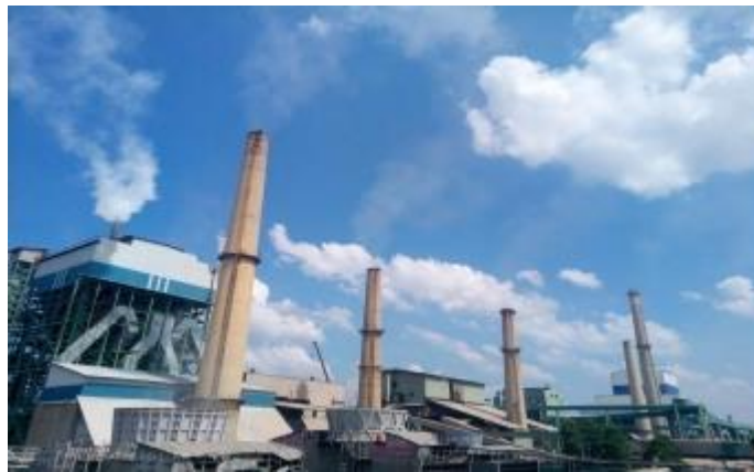
Gambar 1. 2 PT. Indah Kiat Pulp & Paper Perawang

Sementara itu pengoperasian mesin kertas line 3 di pabrik kertas Tangerang dilakukan disamping persiapan lokasi pabrik Pulp di desa Pinang Kabupaten Siak Sri Indrapura, Provinsi Riau.