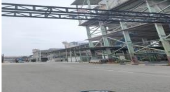
Gambar 1. 3 Penampakan PT. Indah Kiat Pulp & Paper

Indonesia. Pada tahun ini juga dimulai pembangunan Hutan Tanaman Industri (HTI) tahap II.