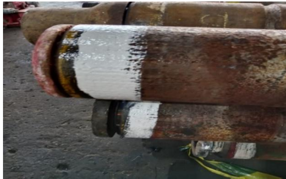
Gambar 3. 4 Sedang Melakukan Pengecatan.