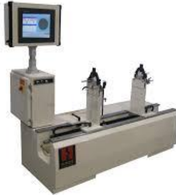
Gambar 4. 7 Balancing Machine