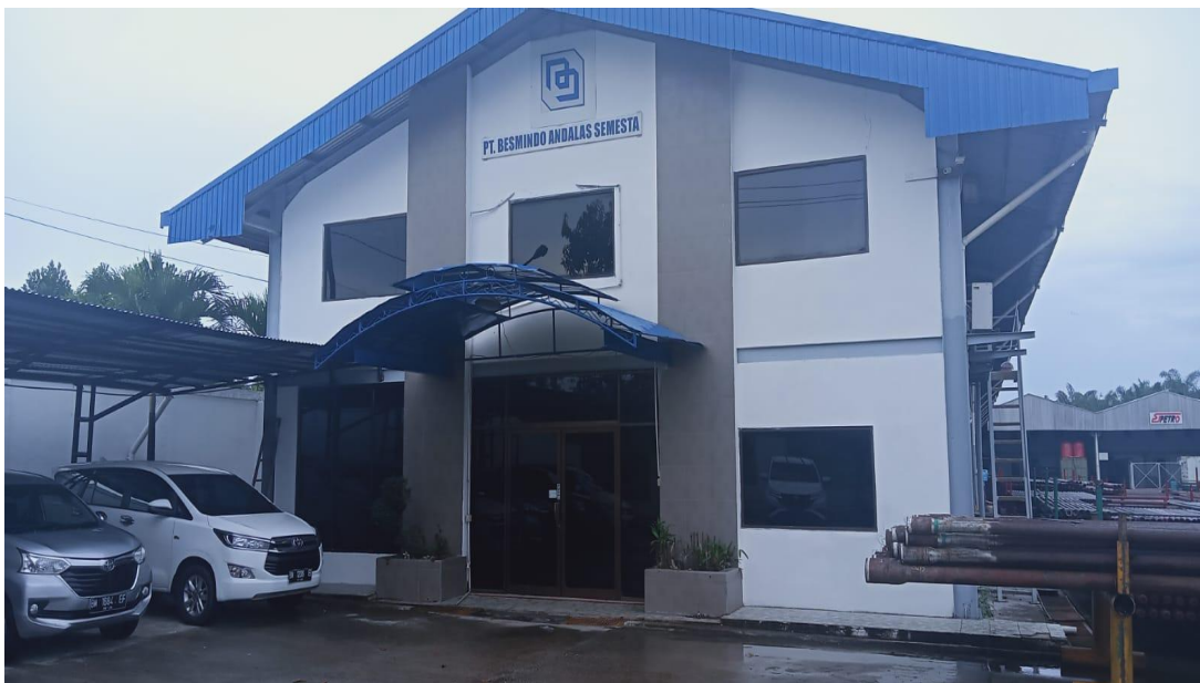
Gambar 2. 1 PT. BESMINDO ANDALAS SEMESTA

Besmindo adalah perdagangan karena PT. BESMINDO ANDALAS SEMESTA didirikan pada tahun 1999 di Duri-Riau, Sumatera, meskipun krisis politik dan keuangan di Indonesia sedang berlangsung pada saat itu. Ini menunjukkan upaya berkelanjutan Besmindo untuk mendukung kliennya, dalam hal ini atas dukungannya kepada PT Caltex Pacific Indonesia (sekarang dikenal sebagai Chevron Pacific Indonesia). Sejak itu Besmindo telah menyediakan produk berkualitas dan layanan terkemuka untuk klien Internasional dan Nasional, Baker Hughes, Bormindo, Century Drilling, Halliburton, Saripari Pertiwi Abadi, Tridiantara Alvindo, Weatherford dan lainnya yang beroperasi di daerah Duri.