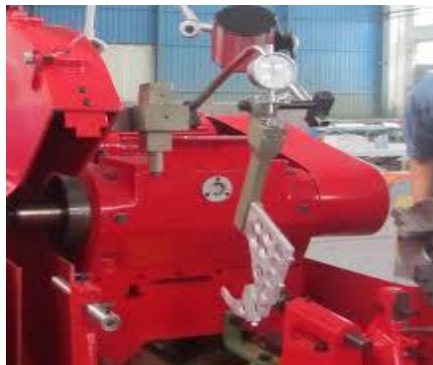
Gambar 4. 5 Measuring Instruments .