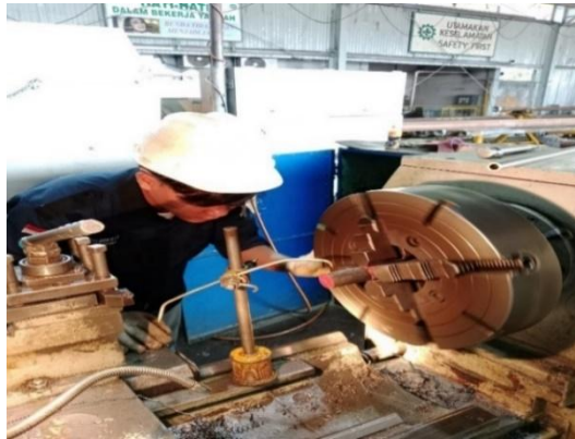
Gambar 3. 1 Sedang Membubut OD.