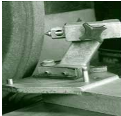
Gambar 4. 8 Dresser .