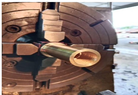
Gambar 3. 9 Sedang Melakukan Pembubutan Material Kuningan.