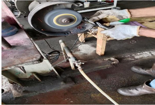
Gambar 3. 3 Sedang Menggerinda.