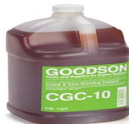
Gambar 4. 6 Coolant .