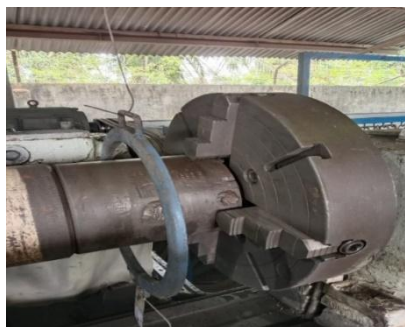
Gambar 4. 9 Chuck