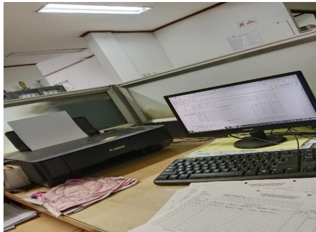
Gambar 3. 5 Sedang Melist Planing di Bulan Agustus.