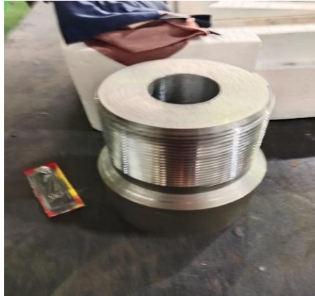
Gambar 3. 10

C. Saya membantu operator bubut membuat lifting cap selama 3 hari dikarenakan Lifting cap disuruh buat 6 buah dan ukuran material disini berbeda dan kami sekalian membuat ulir pada material pembuatan Lifting