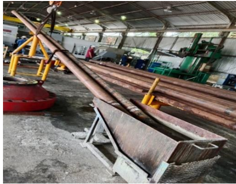
Gambar 3. 6 Sedang Melakukan Zinc Pospat.