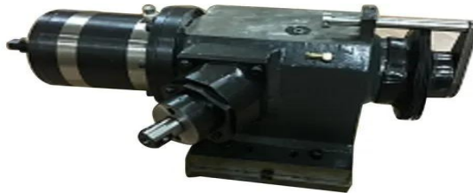
Gambar 4. 4 Tailstock