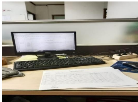
Gambar 3. 2 Sedang Melist Planing Pekerjaan