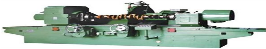
Gambar 4. 1 Grinding Crankshaft.