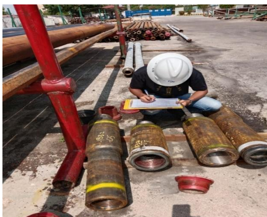
Gambar 3. 7 Sedang Melakukan Receiving Inspection.