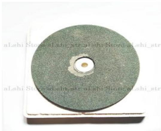
Gambar 4. 2 Batu Gerinda Grinding Whell.