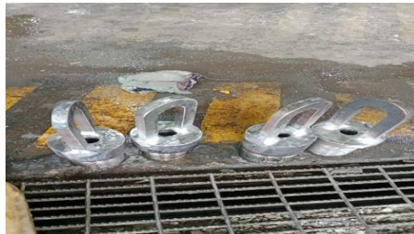
Gambar 3. 11

Pada gambar 3.10 diatas menunjukkan proses pembuatan Lifting cap dan hasil yang dibubut selama 3 hari.