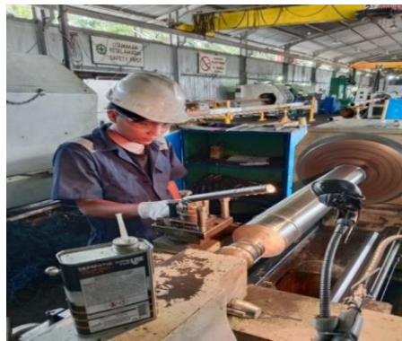
Gambar 3. 8 Sedang Melakukan Pembubutan