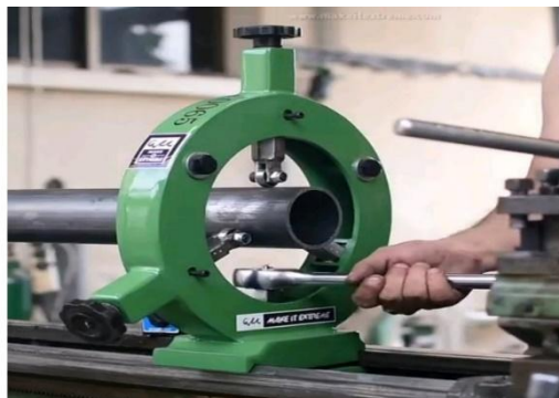
Gambar 4. 3 Steady Rest.