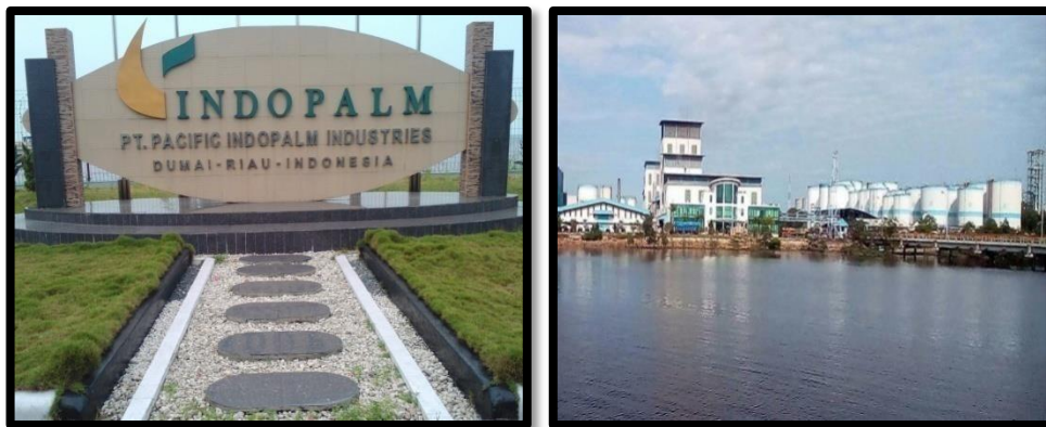
Gambar 1.1 PT pacifik indopalam industries dumai .

PT. Pacific Indopalm Industries terletak di daerah dekat dengan perkampungan penduduk, laut, jauh dari keramaian kota, dan di depan pabrik terdapat perumahan karyawan yang berasal dari luar kota Dumai, dengan tujuan untuk memudahkan akses pada karyawan berkerja.