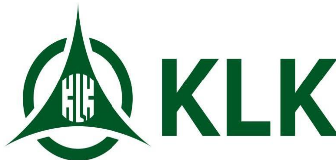
Gambar 1 3 Logo perusahaan PT. KLK Dumai

Adapun logo perusahaan PT. KLK Dumai dapat dilihat pada gambar berikut: