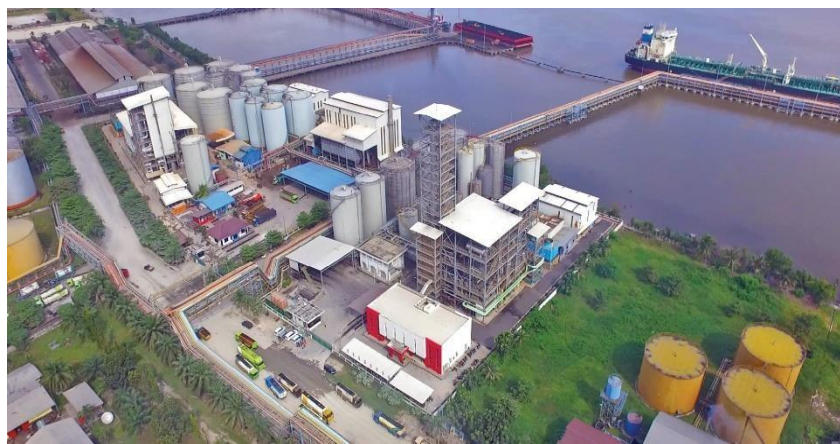
Gambar 1 1 PT. KLK Dumai

PT. Kuala Lumpur Kepong adalah perusahaan multinasional asal Malaysia yang inti kegiatannya adalah pengolahan hasil pertanian (kelapa sawit dan karet). PT. KLK pertama kali membuka cabang di Indonesia tepatnya di Kota Dumai pada 20 Juni 2011 dengan nama PT. KLK Dumai. PT. KLK Dumai merupakan sebuah perusahaan multinasional Malaysia yang terdaftar di pasar utama Bursa Malaysia Securities Berhad dan memiliki kapitalisasi pasar sekitar RM.18 milyar per 30 September 2010.