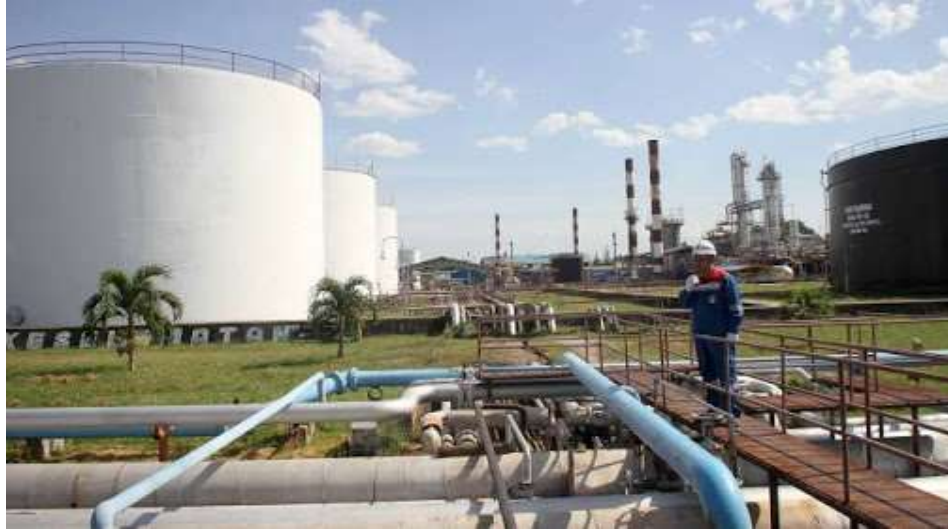
Gambar 1.1 Kilang Produksi PT. Pertamina Kilang Internasional (PT KPI)

35.000 barel perhari. Mencapai 40.000 barel padatahun April 1980. Dan sejak tahun 1982, kapasitas kilang menjadi 50.000 barel perhari, sesuai kapasitas terpasang.