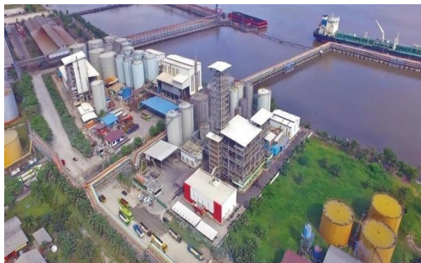
Gambar 1. 1 PT. KLK Dumai

PT. KLK Dumai adalah perusahaan yang didirikan dalam rangka penanaman modal asing sebagaimana dimaksud dalam UU No. 1 tahun 1967 dan UU No. 11 tahun 1970 tentang penanaman modal asing. Persetujuan atas berdirinya perusahaan dari pemerintah Republik Indonesia diperoleh berdasarkan Surat Menteri Negara Penggerak Dana Investasi. Perusahaan ini didirikan atas kerjasamadengan Kuala Lumpur Kepong (KLK Group).