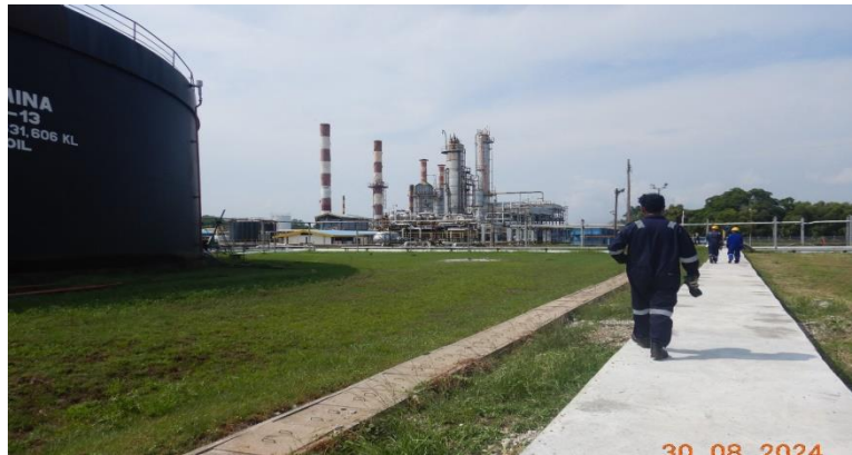
Gambar 1.1 Kilang Produksi PT. KPI Sei. Pakning

barel perhari. Pada bulan September 1975, seluruh operasi kilang beralih dari Reficen kepada pihak Pertamina. Semenjak itu kilang mulai menjalani penyempurnaan secara bertahap sehingga, produk dan kapasitasnya dapat ditingkatkan lagi. Menjelang akhir tahun 1977, kapasitas kilang meningkat menjadi 35.000 barel perhari. Mencapai 40.000 barel padatahun April 1980. Dan sejak tahun 1982, kapasitas kilang menjadi 50.000 barel perhari, sesuai kapasitas terpasang.