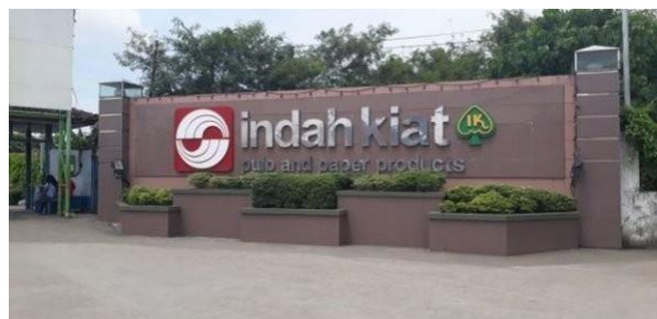
Gambar 1.2 Logo PT. Indah Kiat Pulp & Pulper

Produksi percobaan pabrik pulp dilakukan ditandai dengan peresmian pabrik oleh Presiden Republik Indonesia Bapak Soeharto, pada tanggal 24 Mei 1984. Saat itu kapasitas pabrik pulp sulfat yang dikelantang ( Bleached Kraft Pulp ) adalah 75000 per tahun, sehingga kebutuhan pulp untuk pabrik kertas di Tangerang tidak perlu diimpor lagi, melainkan dipenuhi oleh pasokan pulp dari Provinsi Riau. Pabrik ini merupakan pabrik pulp sulfat kelantang berbahan baku kayu pertama di Indonesia. Pada tahun ini juga dimulai pembangunan Hutan Tanaman Industri (HTI) tahap II.