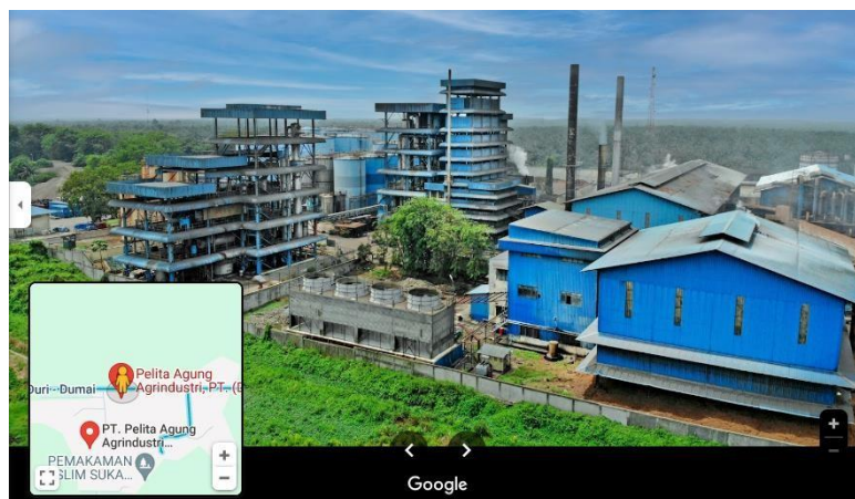
Gambar 1. 1 PT. Pelita Agung Agrindustri

PT. Pelita Agung Agrindustri adalah salah satu dari delapan anak perusahaan Permata Hijau Group (PHG) yang merupakan induk perusahaan yang berlokasi di Medan. PKS ini memiliki luas area sekitar \pm 279.595 \text{ m}^2 atau 27,9595 Ha yang berlokasi di Simpang Bangko, Jl. Lintas Duri-Dumai KM. 22 Desa Bumbung, Kecamatan Bathin Solapan, Kabupaten Bengkalis, Duri – Riau. Posisi barat.