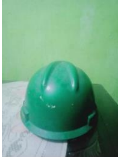
Gambar 3. 3 Pelindung Kepala