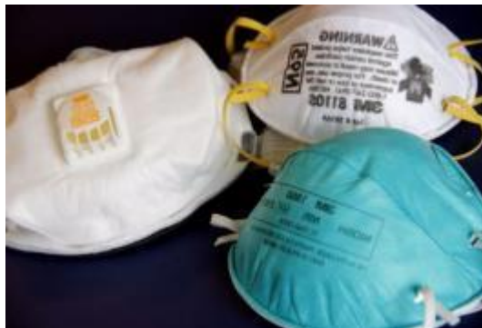
Gambar 3. 6 Masker

Berfungsi untuk melindungi saluran pernapasan pekerja dari berbagai bahaya yang dapat mengancam kesehatan seperti debu, gas, uap kimia, partikel partikel berbahaya lainnya.