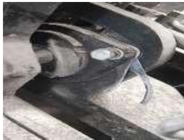
2. Memperbaiki baut bracket hidrolik 2. tilt indikasi kendor restruck MHE