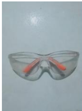
Gambar 3. 2 Kacamata Safety

Berfungsi untuk melindungi mata dari serpihan besi kecil, tajam dan juga panas, dan melindungi mata dari bahan bahan korosif, debu, atau partikel - partikel yang melayang diudara serta pancaran cahaya yang menyebabkan iritasi cahaya.