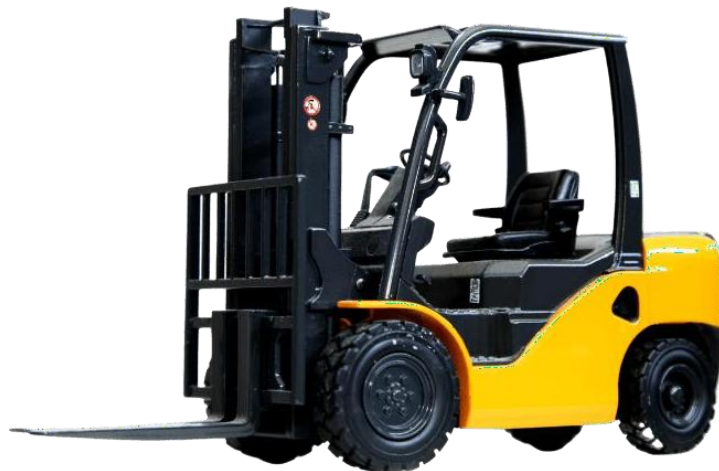
Gambar 4. 3 Forklift Mhe