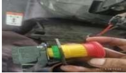
1. Perbaiki Saklar Kunci forklift Lithium MHE