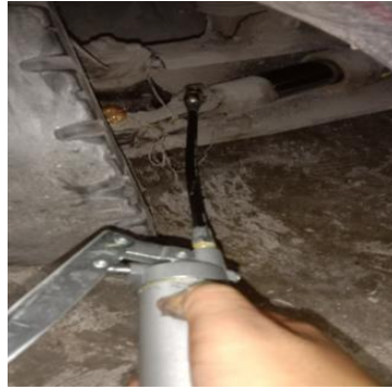
Gambar 4.6 Pelumasan yang tepat