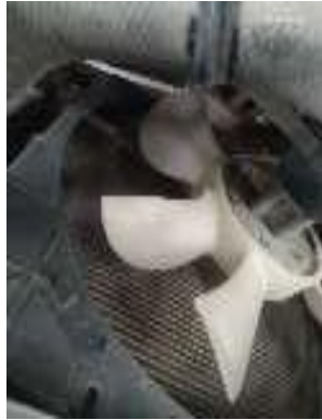
1. Bilah kipas radiator patah Forklift 04