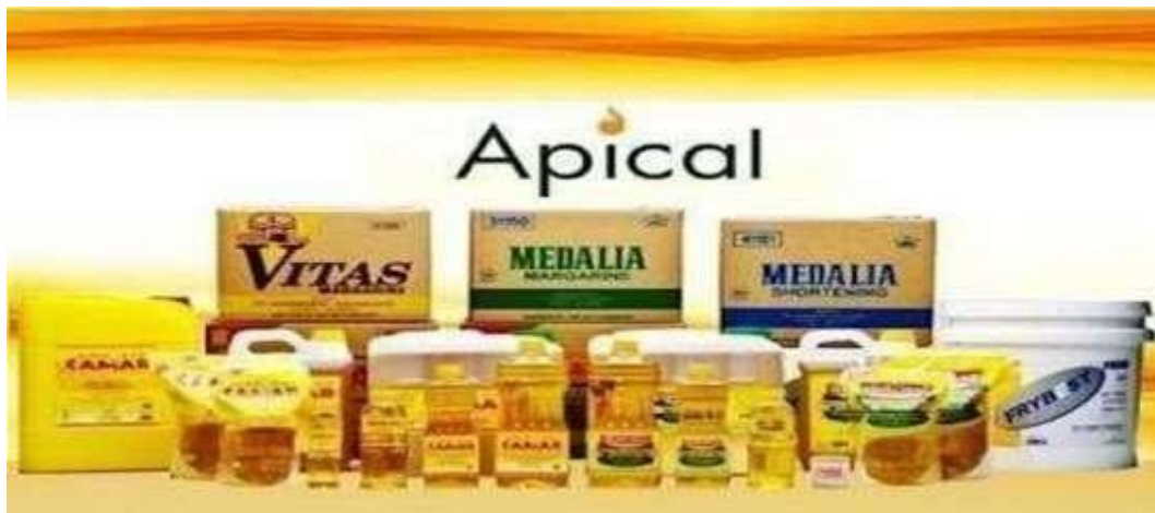
Gambar 2. 1 Produk Utama Apical Group