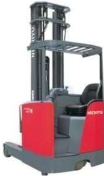
Gambar 4. 2 Forklift Nichiyu