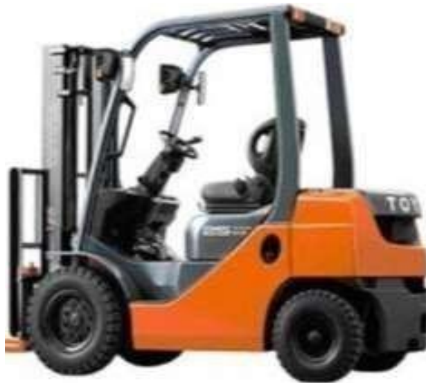
Gambar 4. 1 Forklift Toyota