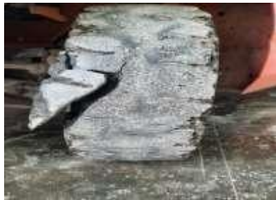
1. Penggantian ban belakang forklift yang robek