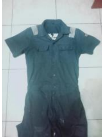
Gambar 3. 1 Baju Safety