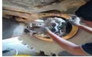
1. Reaples kampas rem ban belakang kiri dan kanan loader 01 new power Plant