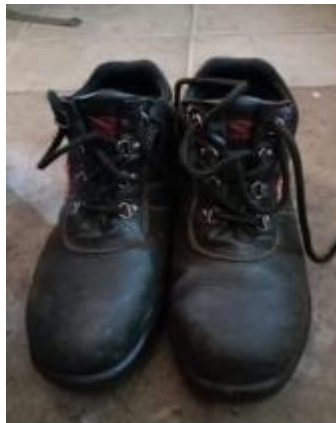
Gambar 3. 4 Sepatu Safety

Sepatu safety adalah salah satu alat pelindung diri (APD) yang harus dipakai oleh para pekerja guna menghindari resiko kecelakaan. Fungsi dari sepatu safety untuk melindungi dari benda tajam dan berbahaya serta melindungi dari benda atau pun material yang terjatuh kebawah.