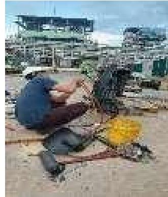
1. Perbaiki tiang must nichiyu patah baut