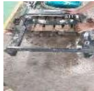
1. Perbaiki mast nichiyu Yang patah