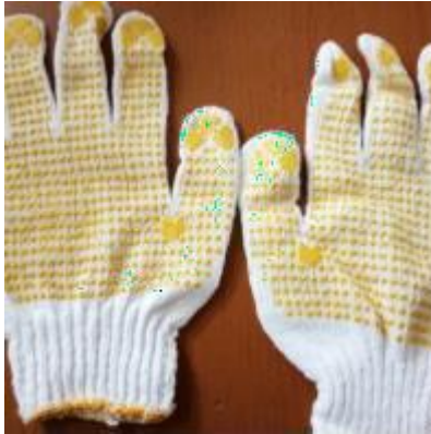
Gambar 3. 5 Sarung Tangan Safety