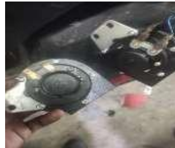
1. Ganti klakson forklift nichiyu Karena tidak bunyi