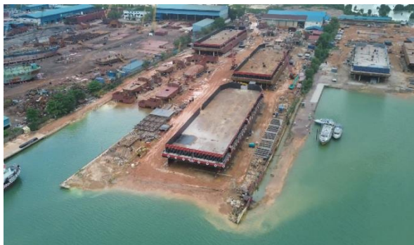
Gambar 1. 3 Dock 1

Digunakan untuk docking/undocking kapal kebanyakan berjenis Tugboat dengan menggunakan sistem docking slipway menggunakan airbag . Dimana Lokasinya berada di Jl. Dapur 12, Sungai Pelunggut, Kecamatan Sagulung, Kota Batam, Kepulauan Riau, 29434 Untuk lebih jelas dapat kita lihat pada gambar 1.3