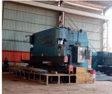
Gambar 1. 7 Mesin bending