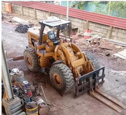
Gambar 1. 13 Loader

Wheel loader adalah truk industri yang banyak digunakan di galangan untuk mengangkat dan memindahkan material yang memiliki fungsi yang hampir sama dengan forklift namun kapasitas bebannya jauh lebih besar dan dapat digunakan dalam jarak jauh. Untuk lebih jelas dapat kita lihat pada gambar 1.13.