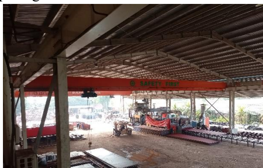
Gambar 1. 12 Crane overhead

Crane Overhead adalah jenis Derek yang digunakan sebagai pemindah barang dengan jangkauan yang terbatas. Bagian Derek gantung berjalan berada di sebuah penyangga berbentuk bangunan. Jenis Derek ini dapat bergerak di sebuah rel. Untuk lebih jelas dapat kita lihat pada gambar 1.12