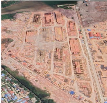
Gambar 1. 4 Dock 2

Digunakan untuk docking/undocking kapal berjenis kapal cargo deck barge/tongkang dengan menggunakan sistem docking slipway menggunakan airbag . dock 2 ini berlokasi di Jl. Putra Jaya Residence, Tanjung ungang, Batu Aji, Kota Batam, Kepulauan Riau, Untuk lebih jelas dapat kita lihat pada gambar 1.3.