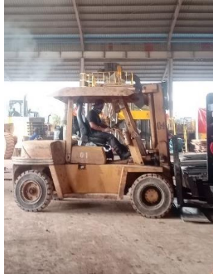
Gambar 1. 11 Forklift

Forklift adalah truk industri yang banyak digunakan di galangan untuk mengangkat dan memindahkan material namun terbatas dalam kapasitas beban dan jarak tertentu. Untuk lebih jelas dapat kita lihat pada gambar 1.11.