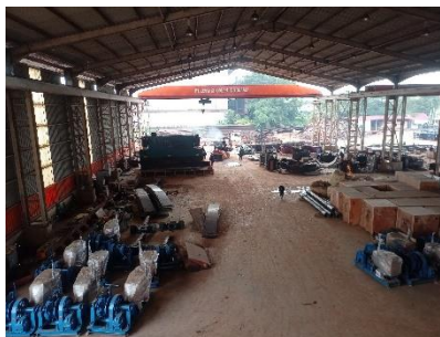
Gambar 1. 5 Workshop

Workshop adalah suatu ruang atau fasilitas khusus yang dirancang untuk kegiatan pembuatan, perakitan, perbaikan, terkait dengan suatu industri atau bidang tertentu seperti sistem propulsi, perpipaan, valve dan equipment yang dibutuhkan kapal. Untuk lebih jelas dapat kita lihat pada gambar 1.5.