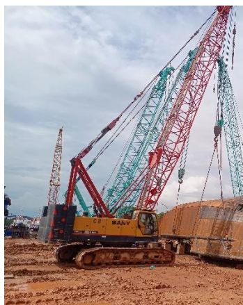
Gambar 1. 10 Crane

Crane adalah sebuah mesin yang digunakan untuk mengangkat benda secara horizontal dan vertikal . Mesin ini dilengkapi dengan kawat atau rantai yang digerakkan dengan katrol sehingga memberikan keuntungan mekanisme melebihi yang bisa dilakukan oleh manusia. Crane yang digunakan berkapasitas 70 ton, 50 ton dan 45 ton