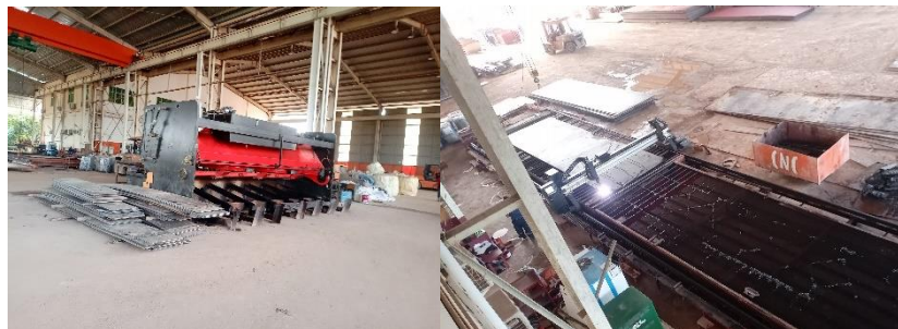
Gambar 1. 6 Mesin pemotong plat dan CNC plasma cutting

Pada bagian ini terdapat 2 mesin yaitu Steel Plate Cutting Machine atau mesin pemotong plat dan CNC Plasma Cutting adalah mesin yang dapat memotong aneka jenis logam atau plat besi dan bahan lainnya dengan tingkat akurasi yang baik. Pekerjaan yang di lakukan di bagian ini berkaitan dengan memotong plat utuh dengan sesuai kebutuhan untuk di gunakan di kapal baik itu trans web , long web , girder , stringer , bracket , ordinary frame , mark pada kapal ( draft , name ship , logo ) dan lain lain . Sesuai kebutuhan plat yang telah di potong selanjut nya di lakukan bending .