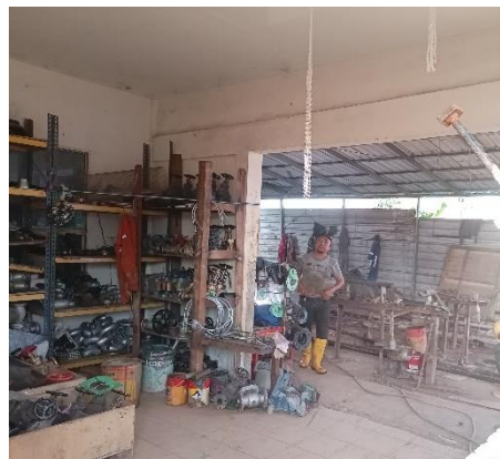
Gambar 1. 8 workshop perpipaan

Pada bagian ini dilengkapi dengan alat las, alat pemotong pipa, alat pembentuk sudut pipa. Workshop I (hull outfitting and heavy equipment support workshop) merupakan workshop tempat proses pengerjaan outfitting dan gudang dari alat-alat berat di perusahaan.