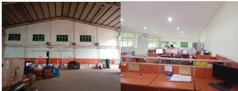
Gambar 1. 2 Main office

Main office merupakan kantor utama general manager , tempat kantor yang mengurus karyawan dan sumber daya manusia, di kantor tersebut juga terdapat ruang rapat dan kantor staf karyawan divisi produksi bangunan baru. Kantor tersebut berada di lantai dua Untuk lebih jelas dapat kita lihat pada gambar 1.2.