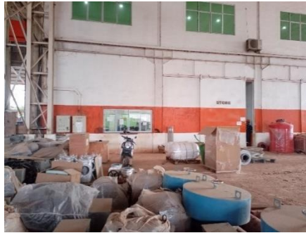
Gambar 1. 9 Store