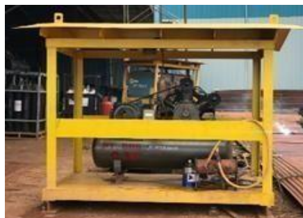
Gambar 1. 23. Compressor