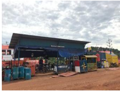
Gambar 1. 8. Workshop Commisisioning