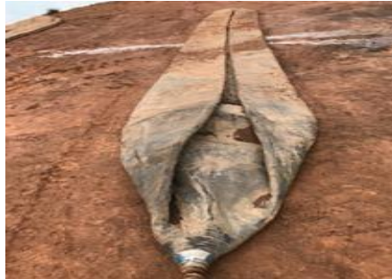
Gambar 1. 12. Air Bags