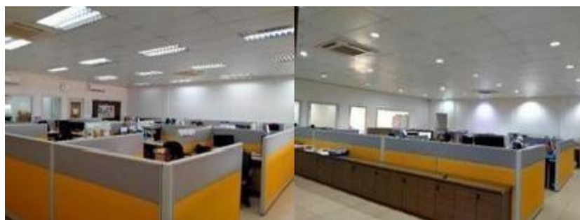
Gambar 1. 3. Main Office