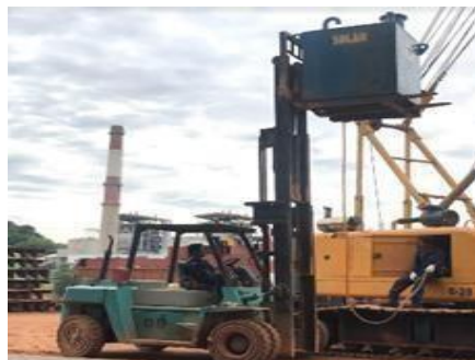
Gambar 1. 15. Forklift