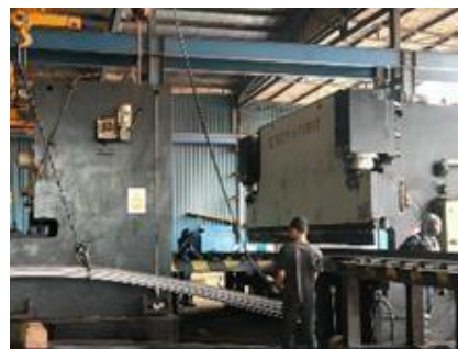
Gambar 1. 18. Shear & Bending Machine 01