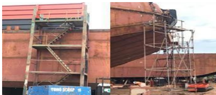
Gambar 1. 27. Ladder