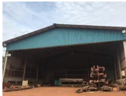
Gambar 1. 6. Workshop Blasting