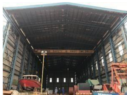
Gambar 1. 7. Workshop Aluminium Boat