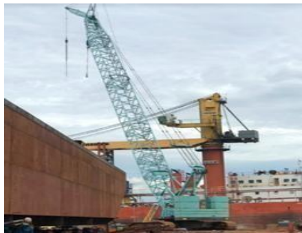
Gambar 1. 13. Mobile Crane