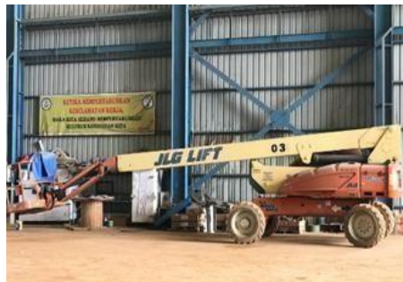
Gambar 1. 14. Main Lift