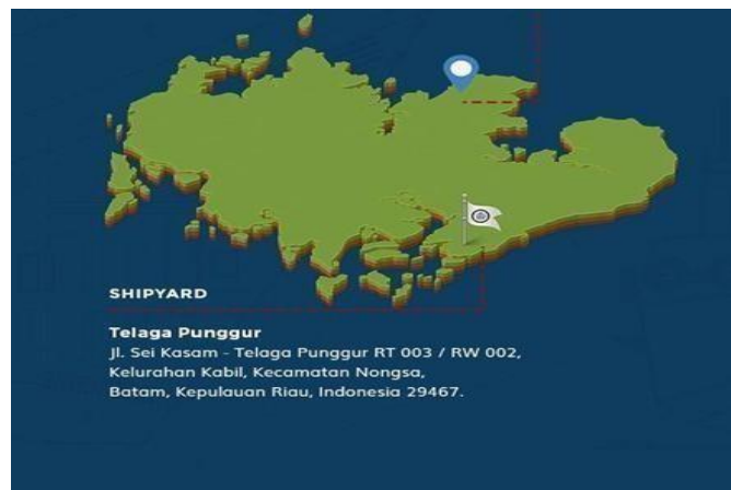
Gambar 1. 1.Lokasi Perusahaan

Didirikan pada tahun 2005 di Batam, Indonesia, PT. Bahtera Bahari Shipyard (BBS) menelusuri sejarah membangun kualitas kapal. PT. Bahtera Bahari Shipyard (BBS) adalah galangan yang melaksanakan pembuatan kapal yang ditunjang dengan sarana pokok berupa lokasi daratan yang cukup luas. Adapun tempat dilaksanakannya pembangunan kapal terdapat pada Galangan jalan Pattimura No.1, Kabil, Nongsa. Secara astronomis terletak pada Lintang Bujur 010 02.758' E 1040 08.277' dan memiliki Luas area ±52 hektar digunakan untuk pembangunan kapal baru, reparasi kapal, dan parkir kapal.