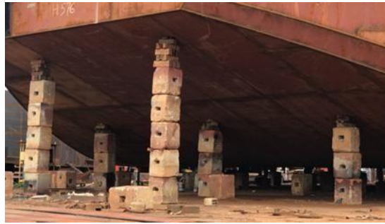
Gambar 1. 28. Stock Block