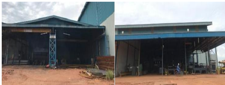
Gambar 1. 5. Workshop Cutting Bending & Rolling