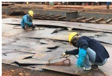
Gambar 1. 21. Brader