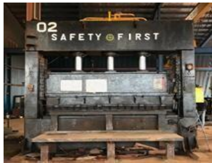
Gambar 1. 17. Bending Machine