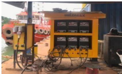
Gambar 1. 22. Welding Machine