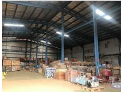
Gambar 1. 4. Store