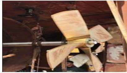
Gambar 1. 24.Chain Block