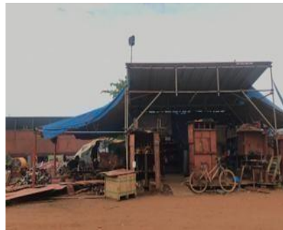
Gambar 1. 10. Workshop Piping