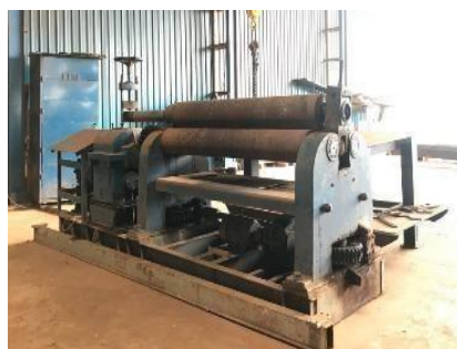
Gambar 1. 19. Rolling Machine