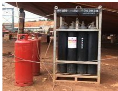
Gambar 1. 26.Tabung Gas (Oxygen dan Argon)