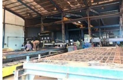
Gambar 1. 16. CNC Machine