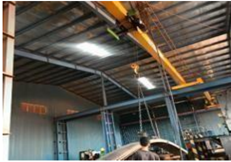
Gambar 1. 20. Over Head Crane