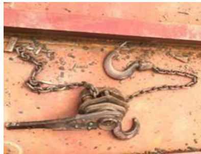
Gambar 1. 25.Lever Block