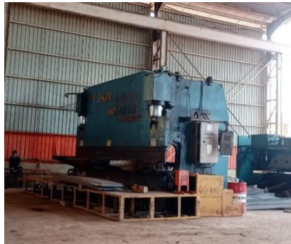
Gambar 1. 7 Mesin bending