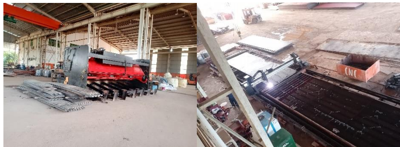
Gambar 1. 6 Mesin pemotong plat dan CNC plasma cutting

Pada bagian ini terdapat 2 mesin yaitu Steel Plate Cutting Machine atau mesin pemotong plat dan CNC Plasma Cutting adalah mesin yang dapat memotong aneka jenis logam atau plat besi dan bahan lainnya dengan tingkat akurasi yang baik. Pekerjaan yang di lakukan di bagian ini berkaitan dengan memotong plat utuh dengan sesuai kebutuhan untuk di gunakan di kapal baik itu trans web , long web , girder , stringer , bracket , ordinary frame , mark pada kapal ( draft , name ship , logo ) dan lain lain . Sesuai kebutuhan plat yang telah di potong selanjut nya di lakukan bending .