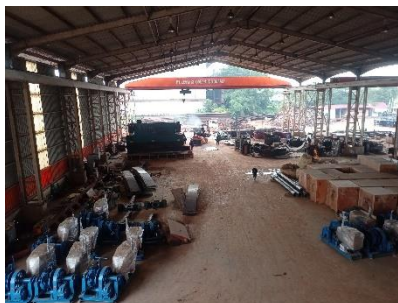
Gambar 1. 5 Workshop

Workshop adalah suatu ruang atau fasilitas khusus yang dirancang untuk kegiatan pembuatan, perakitan, perbaikan, terkait dengan suatu industri atau bidang tertentu seperti sistem propulsi, perpipaan, valve dan equipment yang dibutuhkan kapal. Untuk lebih jelas dapat kita lihat pada gambar gambar 1.5.