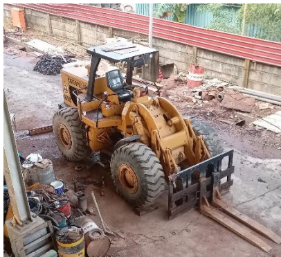
Gambar 1. 13 Loader

Wheel loader adalah truk industri yang banyak digunakan di kalangan untuk mengangkat dan memindahkan material yang memiliki fungsi yang hampir sama dengan forklift namun kapasitas bebannya jauh lebih besar dan dapat digunakan dalam jarak jauh. Untuk lebih jelas dapat kita lihat pada gambar 1.13.