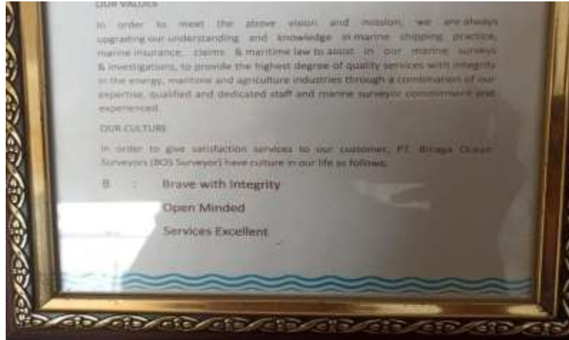
Gambar 1.2 BOS

budaya kerja. Budaya kerja PT. Binaga Ocean Surveyor adalah sikap dan perilaku segenap jajaran yang mengabdikan pada PT. Binaga Ocean Surveyor dalam mencapai tujuan yang telah ditetapkan. Sikap dan perilaku tersebut disingkat dengan BOS,