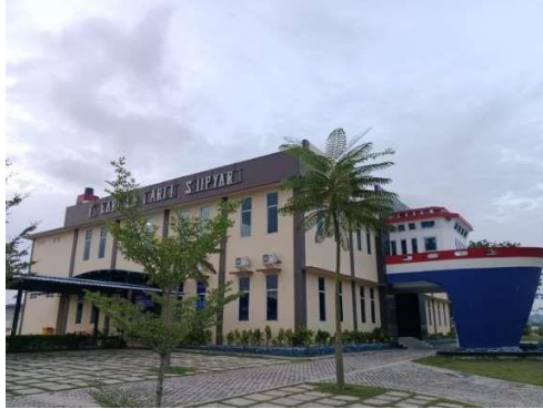
Gambar 1.3 Office

Office di PT. Karimun Marine Shipyard terdapat ruangan receptionis , ruang meeting , ruang manager , ruang engineering , dan ruangan ganti untuk class yang datang dan dilengkapi dengan fasilitas pendukung lain nya. Untuk lebih jelas lihat pada gambar 1.3.