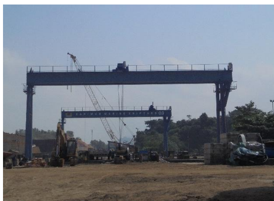
Gambar 1.6 Gantry Crane

Gantry Crane merupakan hoist crane yang memiliki tempat kaki beroda dan bergerak diatas rel yang digunakan untuk mengangkat beban. Untuk lebih jelas lihat pada gambar 1.6.