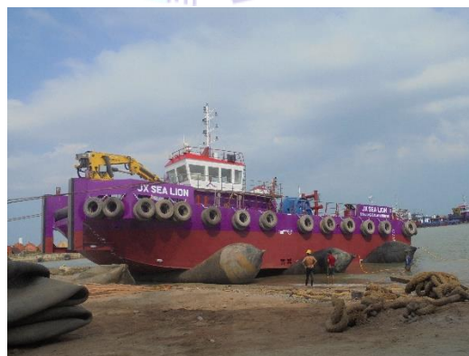
Gambar 1.2 Ballon

Fasilitas slip way yang di gunakan di sini adalah ballon , dimana ballon ini di gunakan untuk proses penaikan dan penurunan kapal dan untuk spesifikasi ballon untuk materialnya natural rubber dengan diameter 0.6- 2.8 m dan panjang 5-24 m. Untuk lebih jelas lihat Gambar 1.2