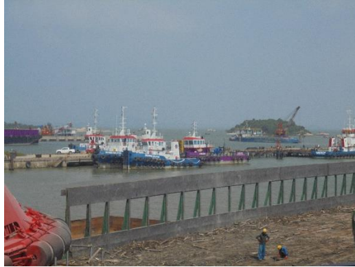
Gambar 1.5 Jetty

Adapun fasilitas yang dimiliki oleh PT. Karimun Marine Shipyard sebagai sarana penunjang untuk jalannya produksi yaitu antara lain: