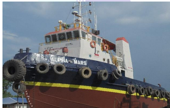
Gambar 1.7 Tug Boat

Merupakan sarana penunjang operasional harian, Fungsi Tug Boat ini antara lain untuk menarik dan mendorong kapal yang akan repair maupun juga untuk menarik kapal baru setelah di lauching . Untuk lebih jelas lihat pada gambar 1.7.