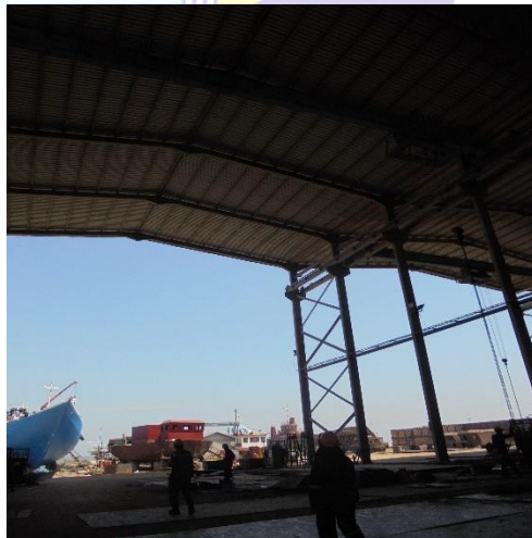
Gambar 1.4 Main workshop fabrication

Main Workshop Fabrication merupakan tempat proses fabrikasi dan kontruksi yang dilakukan didalam sebuah bangunan yang di dalamnya sudah tersedia berbagai macam alat dan mesin-mesin untuk melakukan proses potong plat mesin bending , overhead crane dan lainnya. Untuk lebih jelas lihat pada gambar 1.4.