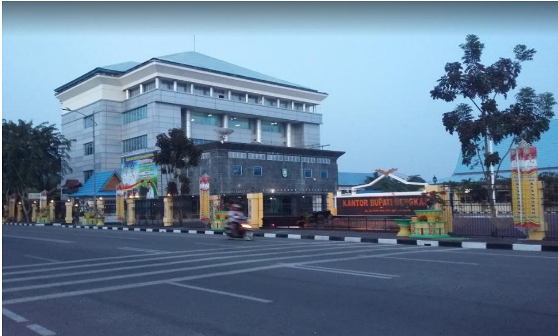
Gambar 1.2 Kantor Bupati Tampak Depan

Tempat pelaksanaan Kerja Praktik (KP) yaitu pada Bagian Organisasi Setda Kabupaten Bengkalis yang beralamat di Jalan Jenderal Ahmad Yani No. 070 Bengkalis 28712.