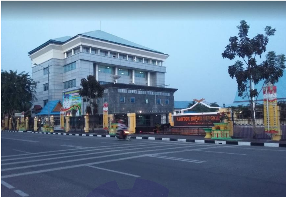
Gambar 1.3 Kantor Bupati Tampak Depan