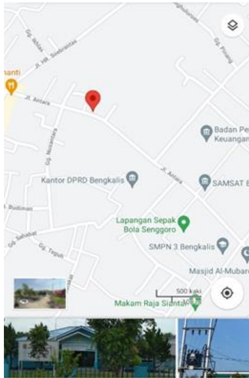
Gambar 1.2 Satelit PT. PLN (Persero) ULP Bengkulu