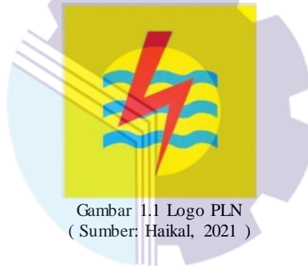
Gambar 1.1 Logo PLN