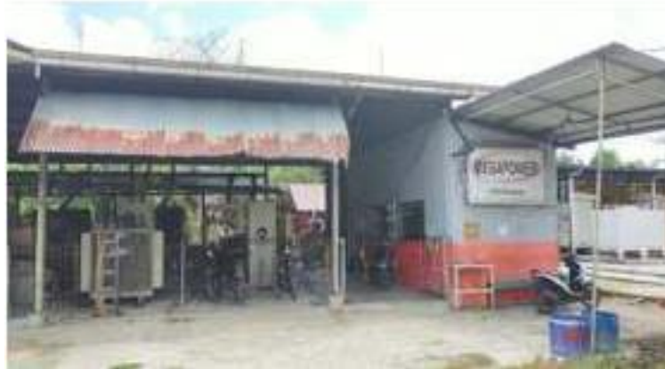
Gambar 1.1 PT. Megapower Makmur Tbk.