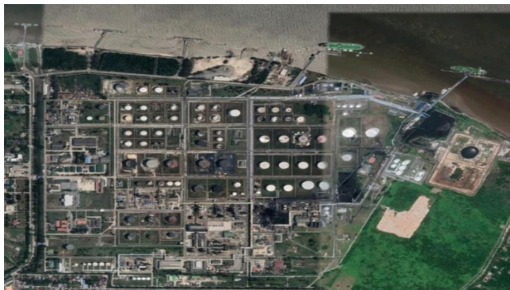
Gambar 1.2 Peta lokasi perusahaan

Pada awalnya PT. Wilmar Nabati Indonesia bernama Bukit Kapur Reksa(BKR) yang terletak di desa bukit kapur dengan jarak kurang dari 30 km dari kota Dumai. Pada tahun 1991 PT. Wilmar Nabati Indonesia yang biasanya disingkat dengan nama PT. WINA berkembang dengan dibangunnya pabrik kedua berlokasi di Jl. Datuk Laksmana Areal Dumai yang kemudian dijadikan sebagai pabrik dan kantor pusat untuk wilayah Dumai.