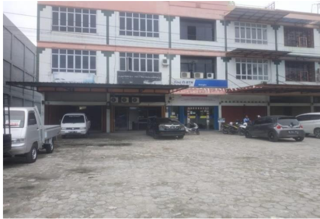
Gambar 1.1 : Kantor pusat PT. DONNY PUTRA MANDIRI