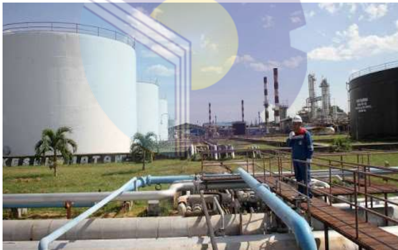
Gambar 1.1 Kilang Produksi PT. PERTAMINA RU II Sei Pakning

Menjelang akhir tahun 1977, kapasitas kilang meningkat menjadi 35.000 barel perhari. Mencapai 40.000 barel pada tahun April 1980. Dan sejak tahun 1982, kapasitas kilang menjadi 50.000 barel perhari, sesuai kapasitas terpasang.