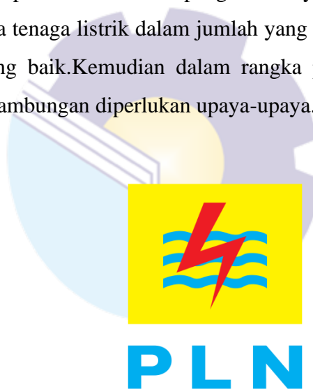
Gambar 1.1 Logo PLN

Mengingat Tenaga Listrik sangat penting bagi peningkatan kesejahteraan dan kemakmuran rakyat secara umum serta untuk mendorong peningkatan ekonomi masyarakat secara khusus, dan oleh karena itu usaha penyediaan tenaga listrik, pemanfaatan dan pengelolaannya perlu ditingkatkan agar tersedia tenaga tenaga listrik dalam jumlah yang cukup merata dengan mutu pelayanan yang baik. Kemudian dalam rangka peningkatan pembangunan yang berkesinambungan diperlukan upaya-upaya.