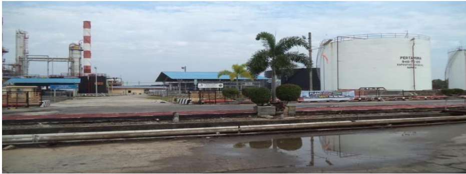
Gambar 1.1 Kilang Minyak PT. Pertamina RU II Sungai Pakning