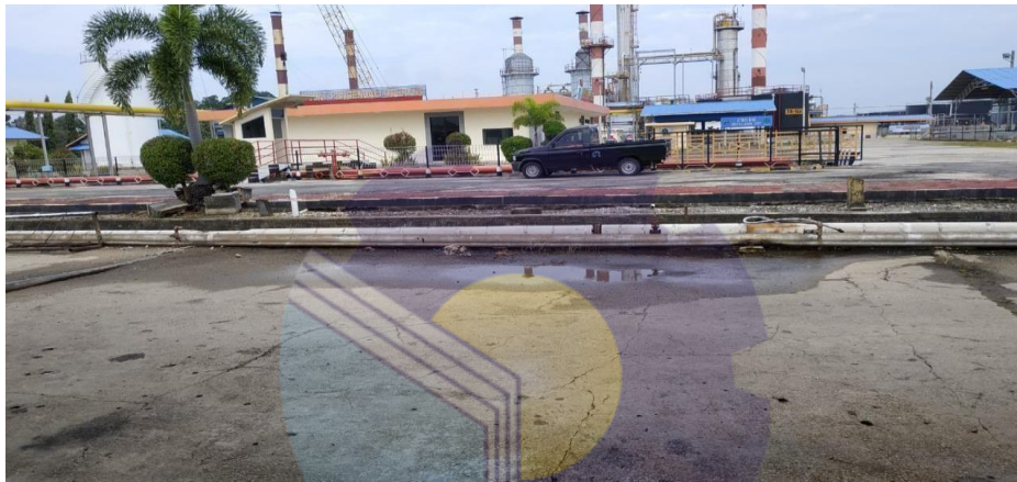
Gambar 1.2 Produksi BBM RU II Sei.Pakning