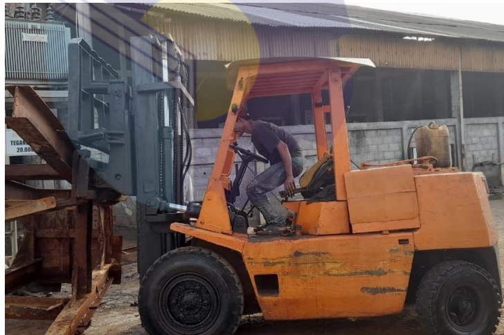
Gambar 1.13 Forklif

Forklif di JMI ada 5 buah dengan kapasitas 3 ton-5ton, dimana alat forklift ini juga sangat penting untuk memindahkan barang dari suatu tempat ketempat lain.