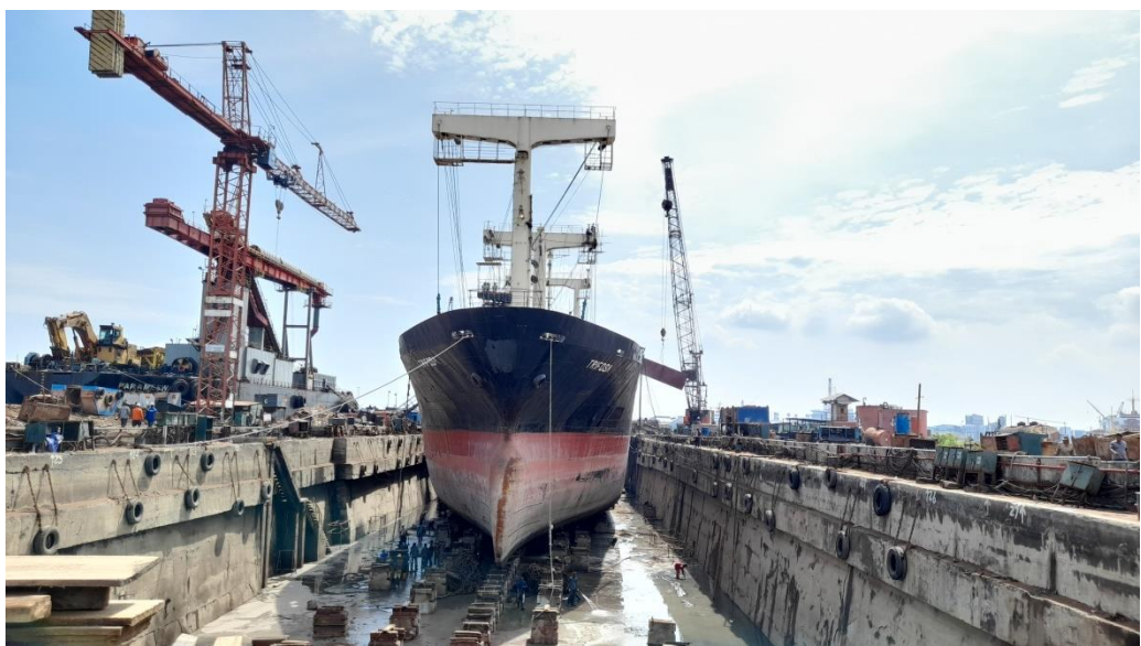
Gambar 1.6 Graving Dock

Graving dock merupakan salah satu sarana yang amat penting di perusahaan ini dimana dengan sarana tersebut, kapal dapat direparasi secara menyeluruh baik bagian di atas air maupun di bawah air. Graving dock juga dapat digunakan untuk membangun kapal baru, tetapi lebih ekonomis dan efisien jika digunakan untuk reparasi kapal. Ukuran graving dock yang ada di PT. Janata Marina Indah ini yaitu berukuran 147,9 m (panjang) x 26,36 m (lebar) x 7 m (tinggi).