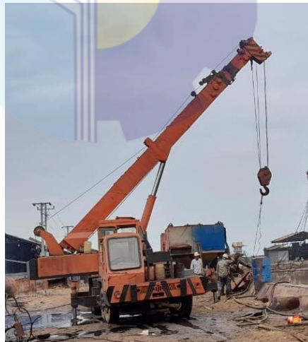
Gambar 1.11 Mobil Crane

Mobil Crane di PT JMI Unit II ada 4 buah dengan kapasitas 5 ton – 15 ton, crane sangat penting untuk kelancaran pekerjaan. Mobil crane umumnya digunakan untuk mengangkat atau memindahkan barang dari di dock atau dari kapal. Mobil crane juga umumnya digunakan untuk mengangkat benda-benda berat diluar pekerjaan docking.