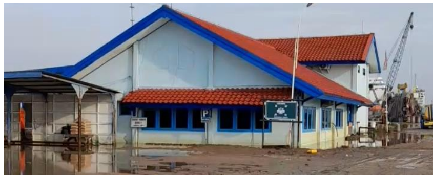
Gambar 1.5 Kantor Utama JMI

Kantor galangan menandakan lokasi fungsi terpenting dari suatu organisasi yang dipimpin. Kantor galangan memiliki tugas penuh dalam mengelola seluruh aktivitas pekerjaan mulai dari pusat koordinasi, rapat.