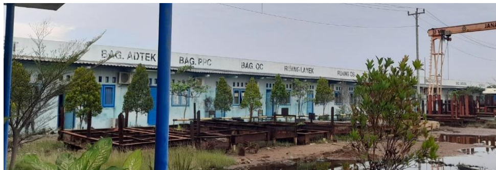
Gambar 1.3 Kantor Bagian

Berikut adalah bagian-bagian yang ada di PT. Janata Marina Indah Unit II