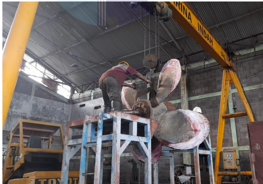
Gambar 1.17 Bengkel Outfitting

Di bengkel outfitting yang terdapat di PT. Janata Marina Indah terdapat beberapa peralatan pendukung seperti mesin pembengkok pipa, mesin gerinda, alat-alat listrik, las asetelin, mesin bor dan mesin bubut di PT. Janata Marina Indah.