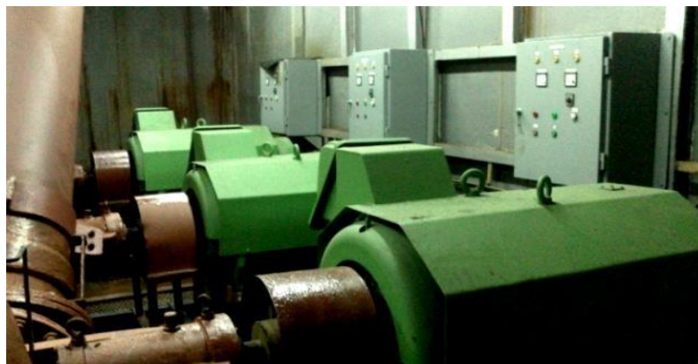
Gambar 1.8 Motor Pompa Graving Dock

Pompa utama pada graving dock ini berlokasi disekitar pintu ponton. Fungsinya yaitu untuk memasukkan air kedalam graving dock ketika kapal hendak masuk lalu mengeluarkan air dari dalam graving dock sehingga kapal bisa duduk ditanjalkan (keel block dan side block) yang sudah disusun sebelumnya. Motor pompa ini memiliki kapasitas 3000 m 3 /jam daya 175 HP (130 kw).