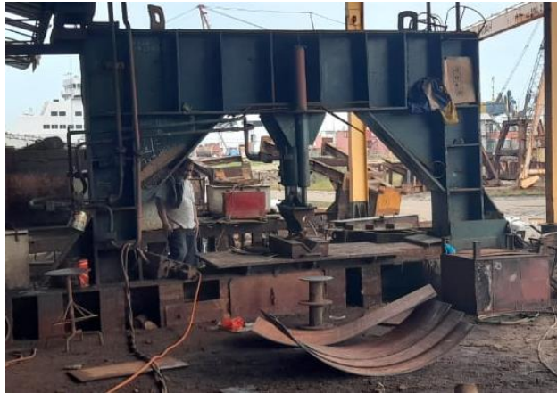
Gambar 1.12 Mesin Bending