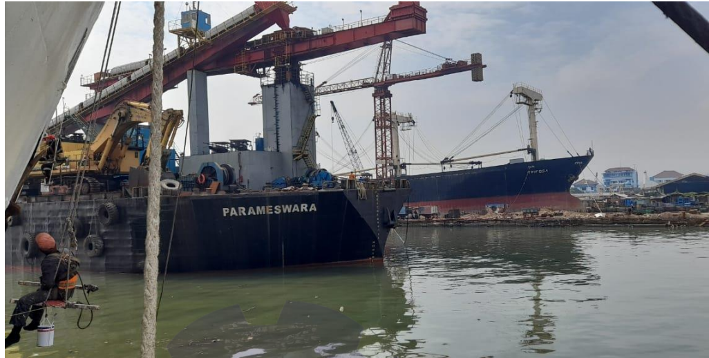
Gambar 1.7 Floating Quay

Fasilitas ini digunakan untuk pekerjaan perbaikan kapal untuk pekerjaan yang bisa dilakukan diatas air. Pekerjaan ringan untuk bagian atas kapal.