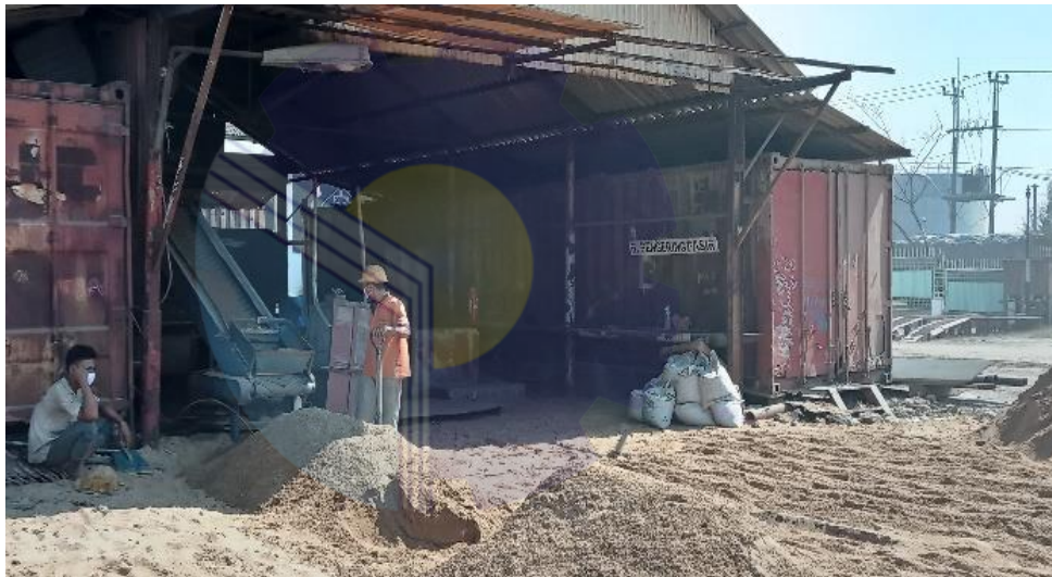
Gambar 1.18 Ruang pengering pasir

ruang pengeringan pasir yang nantinya pasir digunakan untuk melakukan sandblast pada kapal yang akan melakukan reparasi di PT. Janata Marina Indah. Ruangan pasir ini memiliki peralatan pendukung seperti, skop, karung, oven untuk proses pengeringan pasir dan lain-lain.