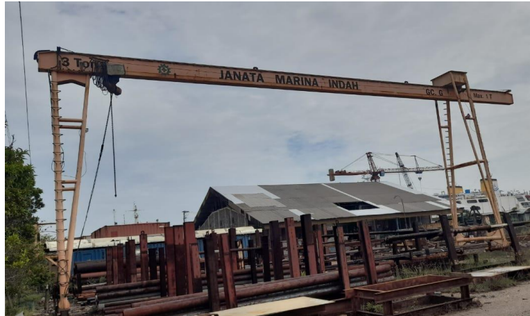
Gambar 1.10 Gantry Crane