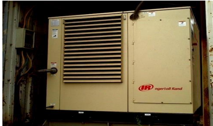
Gambar 1.14 Electric Air Compressor