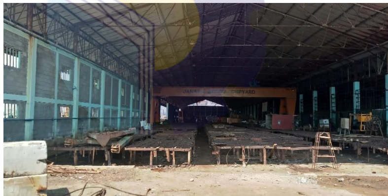
Gambar 1.15 Bengkel Fabrikasi

Untuk bengkel fabrikasi atau bengkel lambung di PT. Janata Marina Indah terdapat berbagai peralatan pendukung seperti: Mesin potong optik otomatis, Mesin press 5 ton, Mesin potong semi otomatis, Mesin bending 30 ton, Overhead Traveling crane 5 ton dan 15 ton.