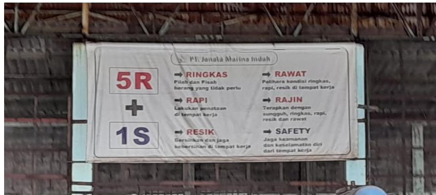
Gambar 1.2 Budaya Kerja 5R+1S